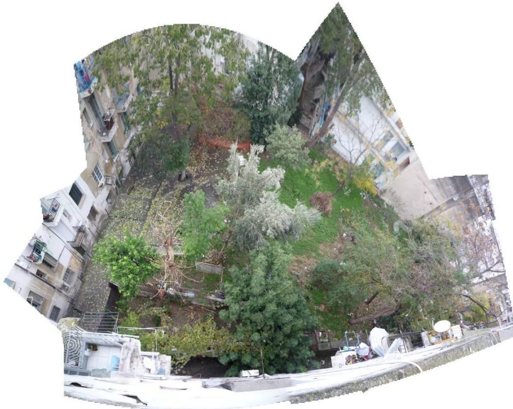
5. Άποψη εσωτερικής κοινόχρηστης αυλής (Δόβα Ε., κ.α. 2013)