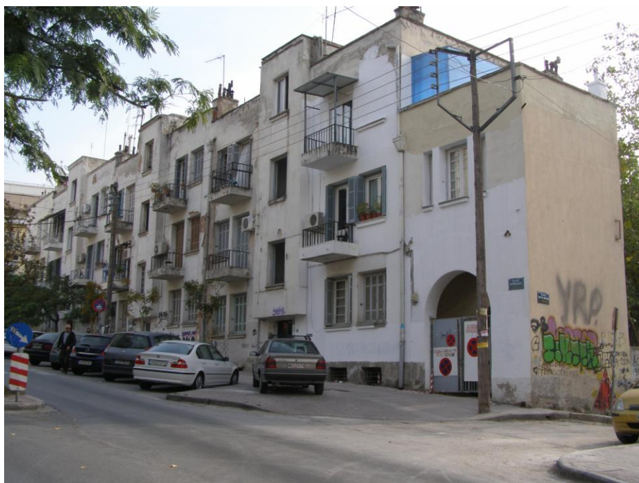
1. Άποψη από συμβολή οδών Ολυμπιάδος και Λαμπουσιάδου (Γεωργίου Ζ. 2012)