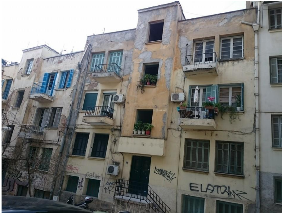
3. Άποψη από οδό Ρακτιβάν (Αντάρας Λ. 2016)