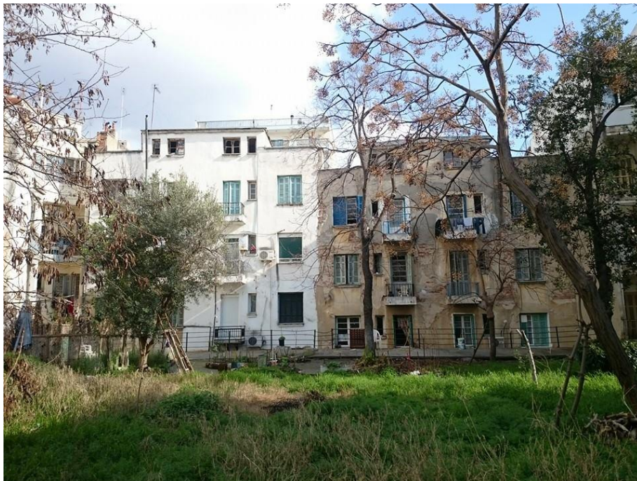
4. Άποψη από εσωτερική κοινόχρηστη αυλή (Αντάρας Λ. 2016)