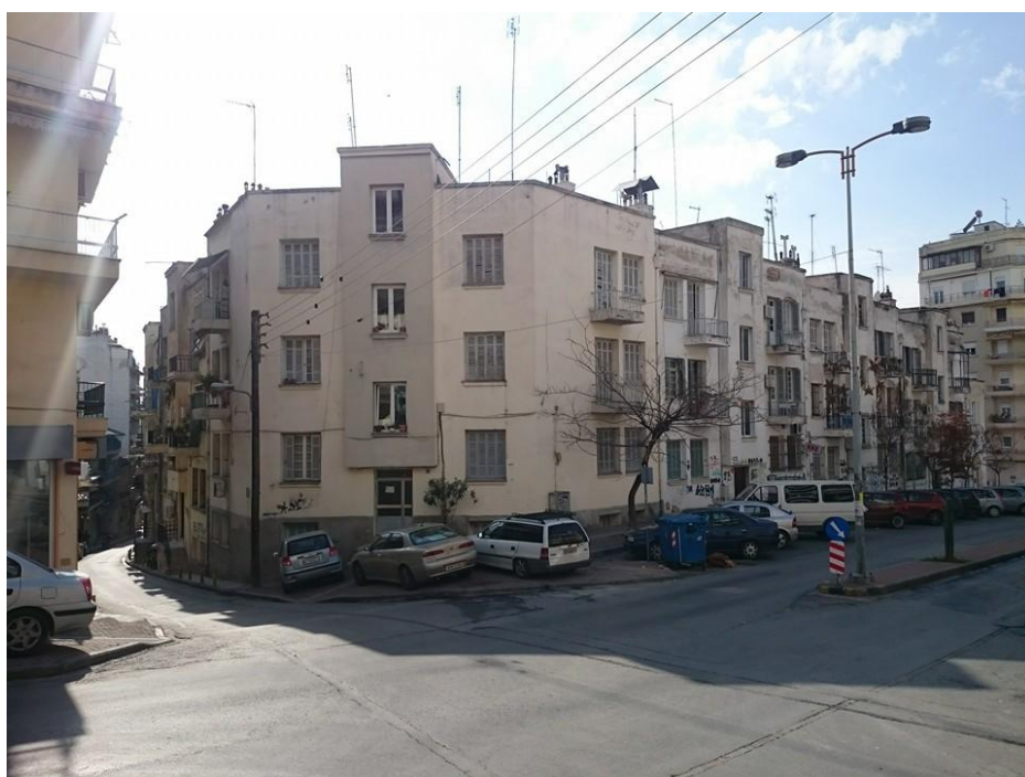
2. Άποψη από συμβολή οδών Ολυμπιάδος και Ρακτιβάν (Αντάρας Λ. 2016)